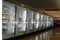
＜冷凍冷蔵ショーケース＞