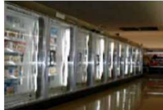
<冷凍冷蔵ショーケース>