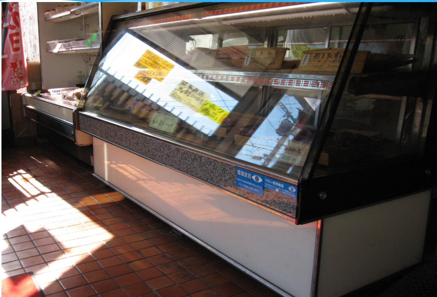
延岡市内・精肉店対面ケース シール貼り付け