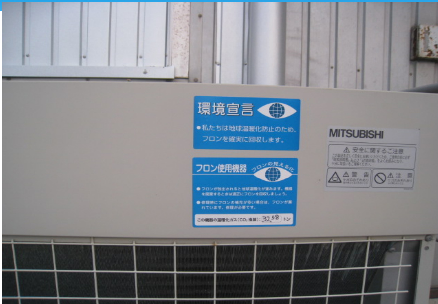
宮崎市内・食品会社・コンデensingユニット シール貼り付け