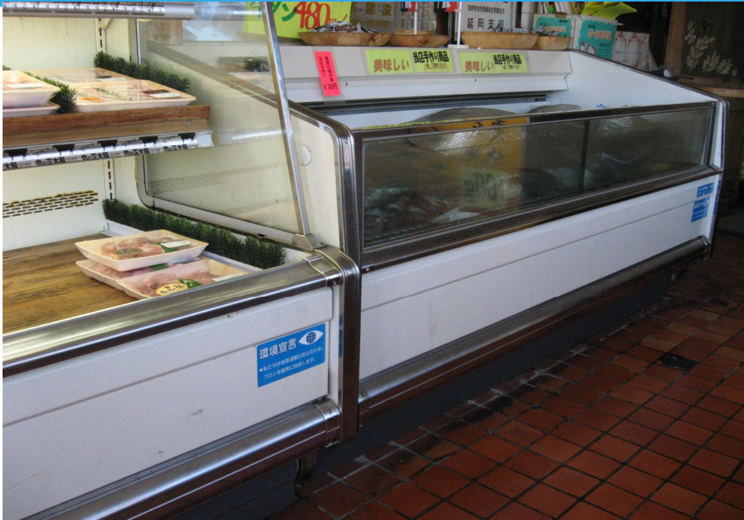
延岡市内・精肉店・オープンケース・平ケース シール貼り付け