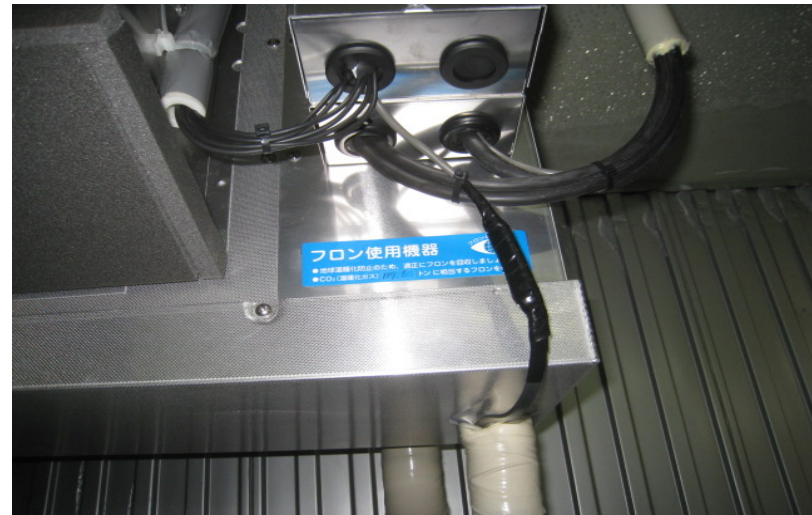
宮崎市内・食品会社・ユニットクーラー シール貼り付け