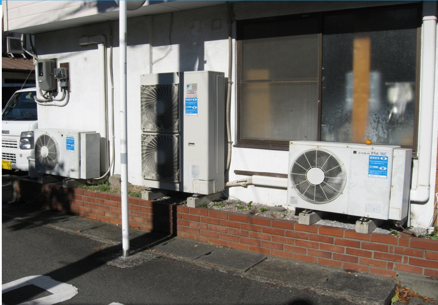
延岡市内・精肉店オープンケース他コンデシングユニット 見える化シール貼り付け