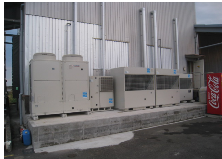
宮崎市内・食品会社・コンデシングユニット シール貼り付け