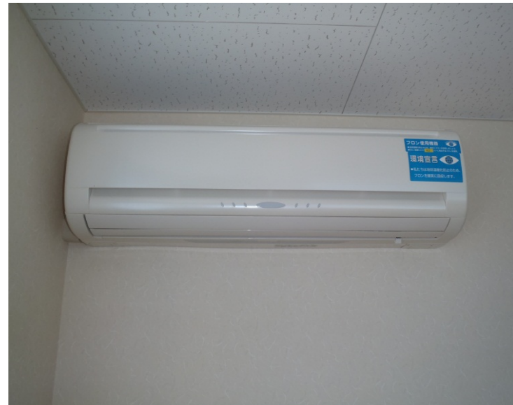
延岡市内・事務所・エアコン室内機 見える化シール貼り付け