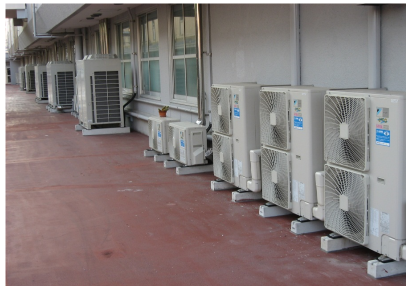
旭化成・延岡支社・事務所・エアコン室外機 見える化シール貼り付け