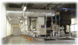
<中央方式冷凍冷蔵機器>