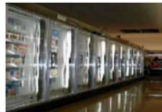
<冷凍冷蔵ショーケース>