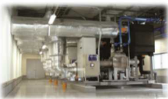
<中央方式冷凍冷蔵機器>

高い省エネ効果を有し、HFCを使用しない自然冷媒への転換が求められる 冷凍冷蔵倉庫、食品製造工場、食品小売店舗 において、省エネ型自然冷媒機器の導入を補助する。