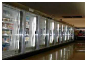
<冷凍冷蔵ショーケース>